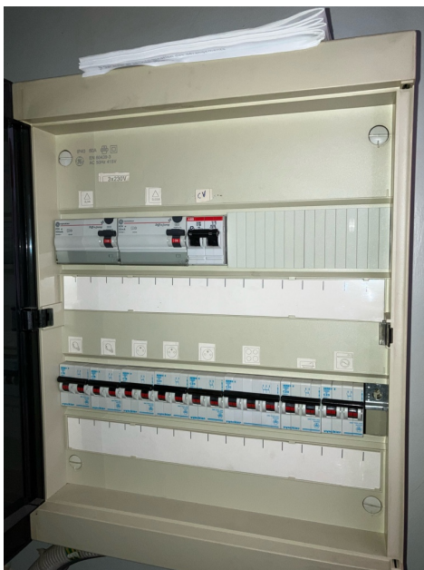
( Elektrisch bord )